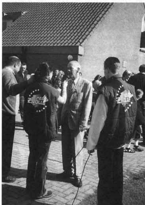
Radio Zwolle deed een rechtstreeks verslag.