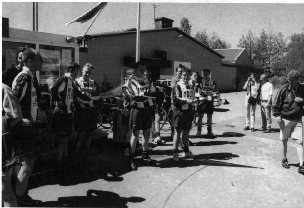
Bij een promotie hoort een statieportret, dus met z'n allen naar de sponsor BP tankstation J. Brasjen aan de Nieuwe Deventerweg, om de foto te schieten.

Als je als tweede eindigt kan men tevreden zijn, vaak is het andersom, ben je teleurgesteld omdat je het net niet gehaald hebt. Nou voor mij is het geen teleurstelling, deze tweede plaats betekent voor mij net zoveel als een kampioenschap alleen op een andere manier. Als je weet dat Nunspeet twee het seizoen ervoor bijna Nunspeet één was met betaalde spelers zijn wij de morele kampioen. Op het laatst verloren we punten maar we hadden voldoende opgebouwd zodat de tweede plaats niet meer in gevaar kwam. De laatste wedstrijd uit tegen VWF twee (iedereen kent de story) konden we gerust laten lopen. We speelden de tweede helft niet in de sterkste opstelling (een paar spelers waren bij het eerste) en omdat we er nog vanuit gingen dat we na-competitie moesten spelen werden enkele belangrijke spelers gespaard. Een paar uur na afloop hoor je in de kantine van SVI via de KNVB dat je geen na-competitie hoeft te spelen en dat je bent gepromoveerd naar de res.