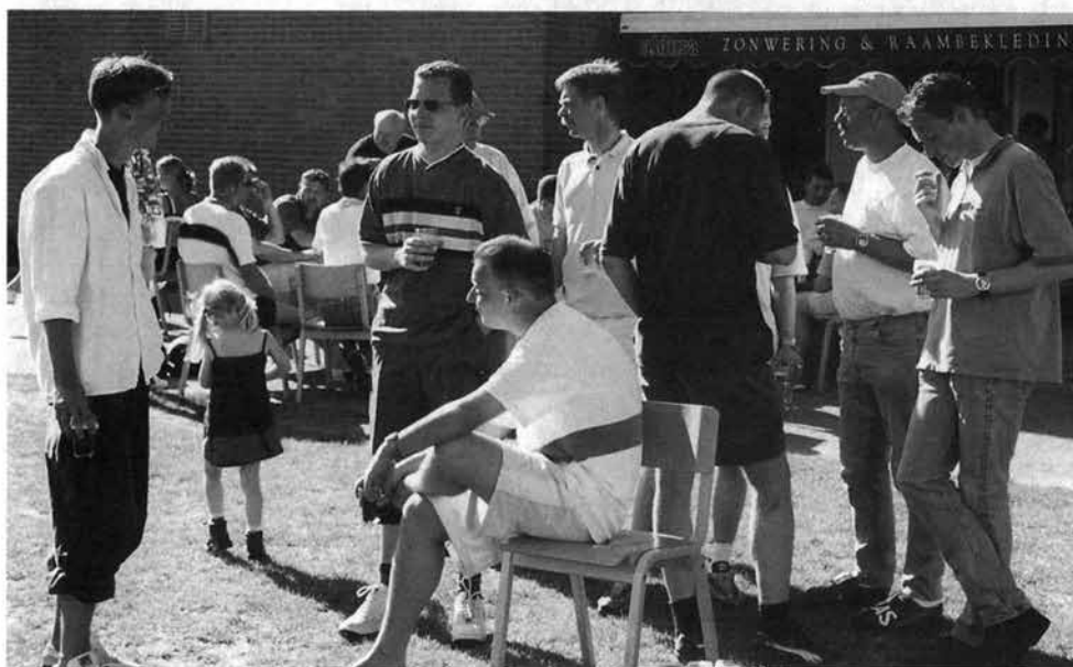
Na afloop van de fotosessie was het gezellig toeven op en rond het terras waar we getuige waren van de kampioenswedstrijd van het 3e elftal tegen CSV '28 uitslag 7-1 voor SVI 3.