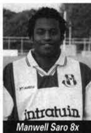
Manwell Saro 8x