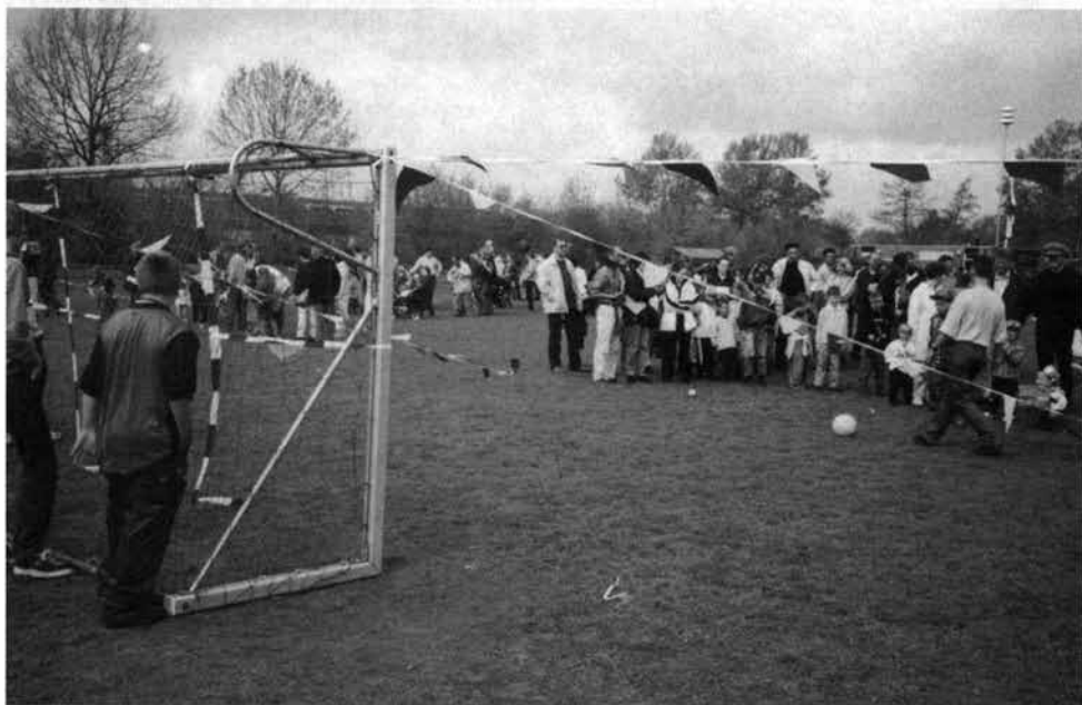
Doelschieten was een van de onderdelen tijdens de spelletjes morgen.