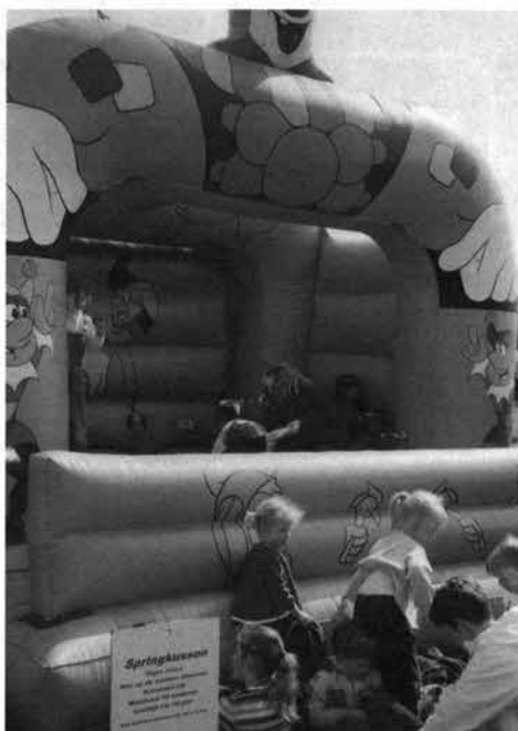
Natuurlijk ontbrak het springkussen niet.