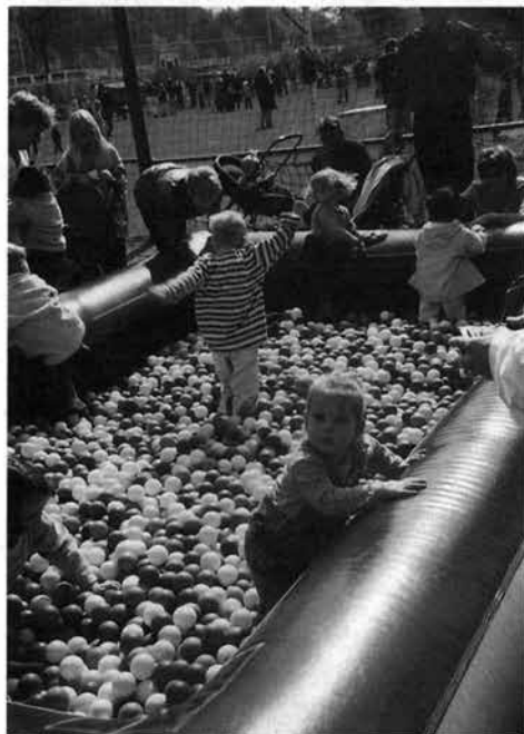
Ook de allerkleinsten hadden plezier.

Om de activiteiten voor koninginnedag in Zwolle Zuid te waarborgen is het noodzakelijk dat er nieuwe bestuursleden komen om de werkzaamheden voort te kunnen zetten. Niet alleen om de vertrekkende bestuursleden te vervangen want naast vervanging is er ook behoefte aan uitbreiding van het bestuur naar minimaal zeven leden. Dit om een betere verdeling te kunnen krijgen van de werkzaamheden van het comité.