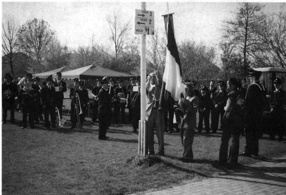
De vlag wordt gehesen op sportpark "De Siggels".

Door verhuizing buiten Zwolle en om persoonlijke redenen heeft een aantal bestuursleden te kennen gegeven hun werkzaamheden voor het Oranje Comité na de viering van Koninginnedag 2001 te willen beëindigen. Daaronder is ook onze huidige penningmeester en daarom zoeken wij met de grootst mogelijke spoed een nieuwe penningmeester. Inlichtingen bij het secretariaat 038-460 55 60 of via telefoonnummer 038-465 56 43.